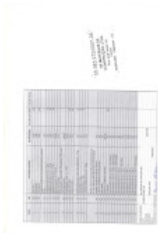
1324 001.jpg 1128K

Erick <erick.joacaba@gmail.com> Para: Evandro Segalin <se.loja2112@gmail.com>