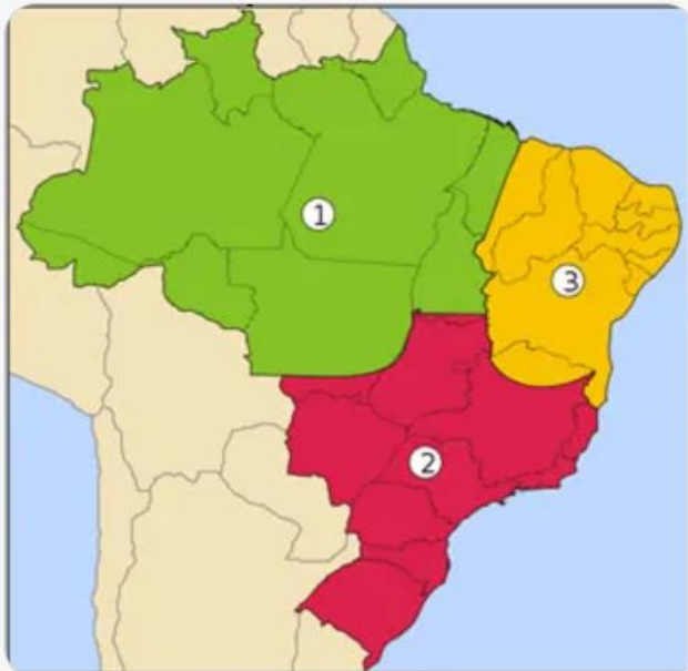
Figura 1 - Regiões Geoeconômicas do Brasil